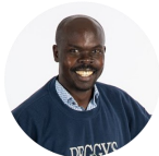
DEO Responsable, immobiliers

Le 14 mars 2020, la Maison du Père perdait 72% de ses 175 bénévoles en raison de leur âge ou de leur état de santé. Malgré l'implication des employés des services administratifs et des usagers, nous n'avions d'autres choix que de recruter de nouveaux bénévoles pour assurer le bon déroulement des opérations. Ce recrutement n'a pas été fait à la légère. Les candidats devaient répondre à un questionnaire et s'engager à s'impliquer de façon régulière, afin de limiter les accès à la Maison. Nous devions également les former aux nouvelles normes d'hygiène et de sécurité. Heureusement, nous avons réussi à monter rapidement une équipe d'hommes et de femmes dynamiques pour nous soutenir.